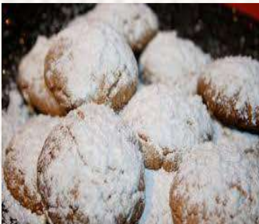
Voici des gâteaux typiques de Noël