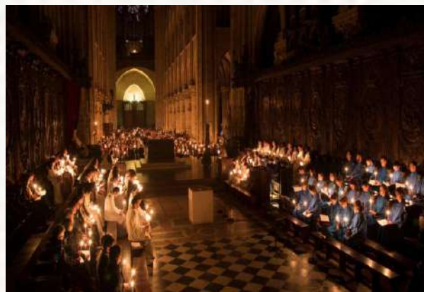
Messe de minuit

Beaucoup de Grecs assistent à la messe, allumant des bougies pour symboliser la lumière et la messe de minuit pour célébrer la nouvelle année .