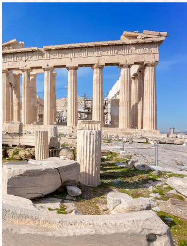
Temple de Zeus