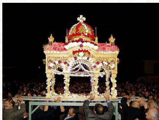
Le symbole du tombeau du Christ.

Les œufs rouges représentent le sacrifice du CHRIST et la vie éternelle.