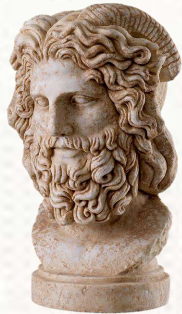
Statue de Zeus

Il renverse son père et il conduit les dieux à la victoire contre les titans. Il montre sa domination et sa place de Dieu des Dieux dans de nombreuses aventures.